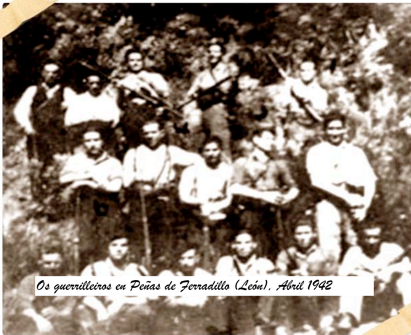
Os guerrilleiros en Peñas de Ferradillo (León), Abril 1942