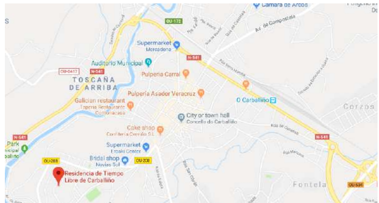
O Carballiño fica a 28 km ao noroeste de Ourense