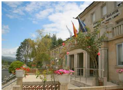
Residencia de Tempo Libre do Carballiño