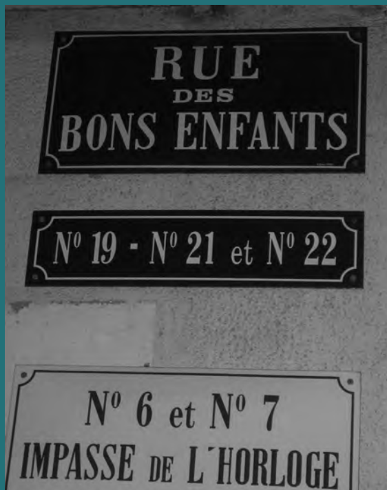
A memoria descobre, igualmente, curiosidades. Esta é de Mulhouse (Francia)